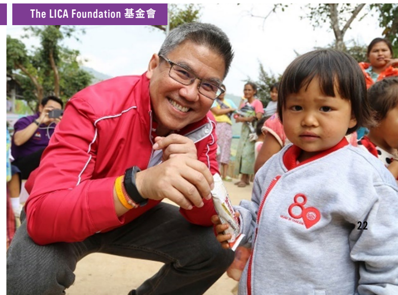
The LICA Foundation 基金會