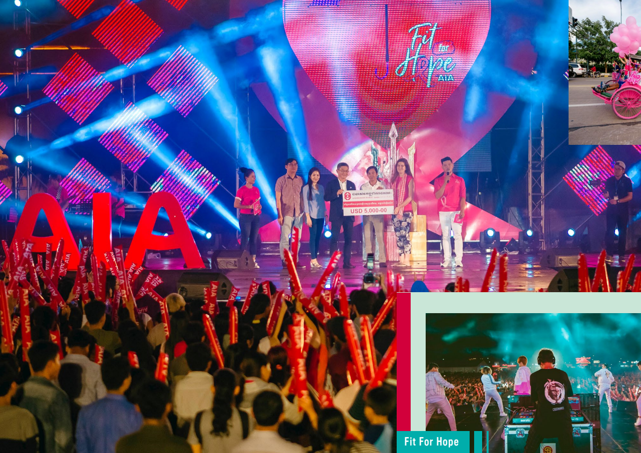
Fit For Hope