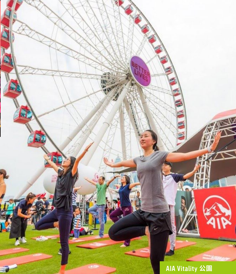
AIA Vitality 公園