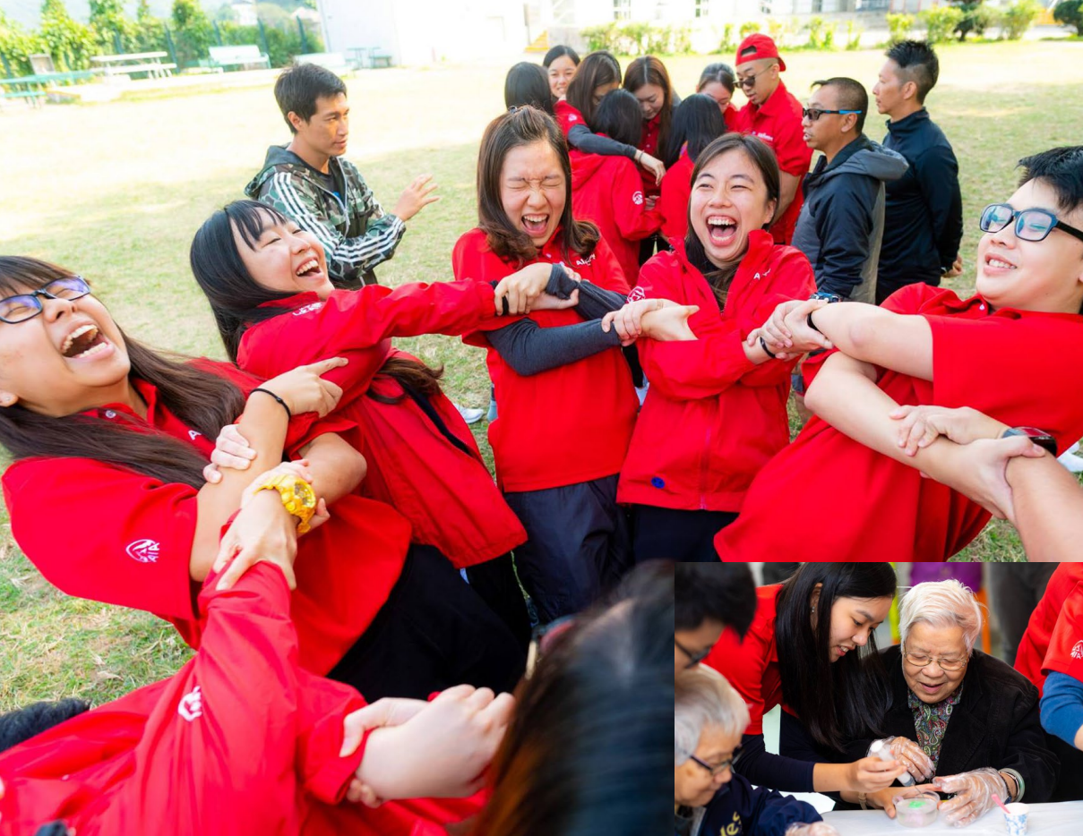
友邦保險基金會年輕領袖發展項目