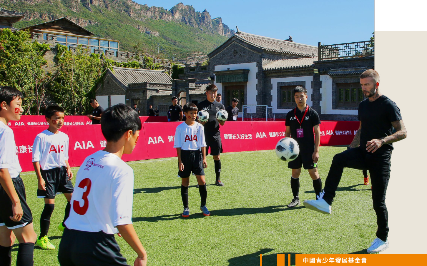
中國青少年發展基金會