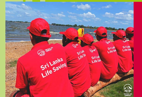
斯里蘭卡救生協會

警察局以及斯里蘭卡海軍的救生人員擔任危險洗浴場所的巡邏工作。這個項目實施以來，普桑節期間沒有死亡數字。這也是我們自1993年起持續最久的一個企業社會責任項目，估計挽救的人數達200人以上。