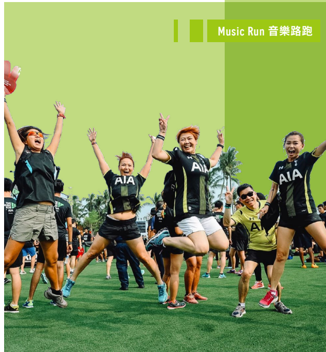
Music Run 音樂路跑

為了提倡社會和諧以及家庭團結，我們在新加坡首次舉辦了「AIA Family Fest」。這是一場趣味十足的活動，內容包括即興藝術、露天電影、園藝、農耕以及足球培訓等。活動吸引了3,000個家庭參與，一同共享時光。