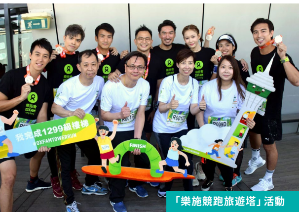
「樂施競跑旅遊塔」活動